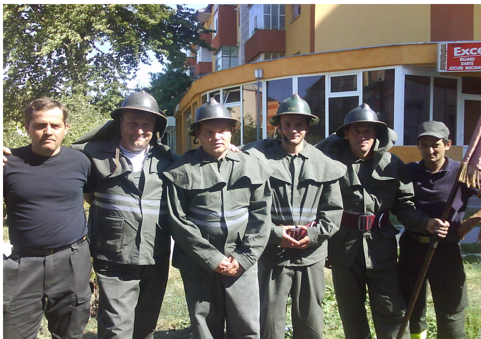
POZA CU MEMBRII.....